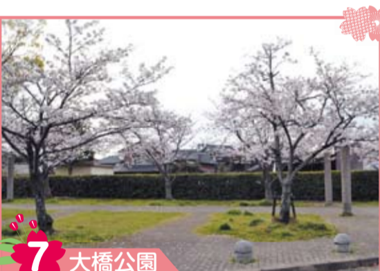
7 大橋公園 現在公園になっていますが、昔は藩主が領内巡回の時に休憩や宿泊をする御茶屋がありました。明治時代には御茶屋の建物を利用し大橋洋学校が開校されました。