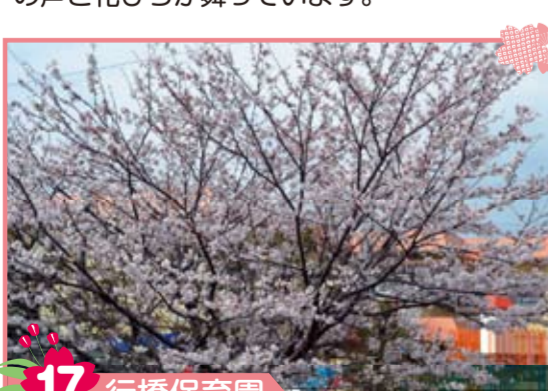
17 行橋保育園 行橋保育園前の船路川沿いに大きな桜があります。