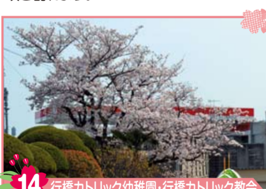
14 行橋カトリック幼稚園・行橋カトリック教会 桜の木の下には子どもたちに一番人気の遊具があります。開花時は、かわいい天使たちの声と花びらが舞っています。