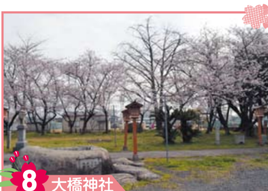
8 大橋神社 境内に記念植樹の標柱があり、標柱の裏側には「1973年 行橋ライオンクラブ」と書かれています。