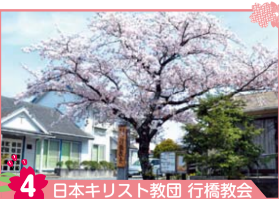
4 日本キリスト教団 行橋教会 赤レンガの礼拝堂玄関にある桜は樹齢不明ですが、隣のキャラボクの緑と相まって落ち着いた雰囲気を感じさせています。