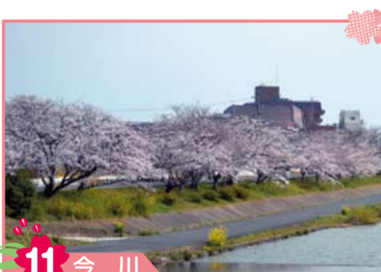
11 今川 今川は英彦山を源流とする二級河川です。春には両岸あわせて約450本の桜が見事に咲き乱れます。