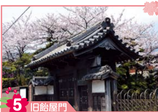
5 旧船屋門 旧船屋門は通称「御成門(おなりもん)」と呼ばれ、小倉藩主が廻部(かいくん)(領内巡察)などで船屋を訪れた際、藩主を迎えるために建てられました。