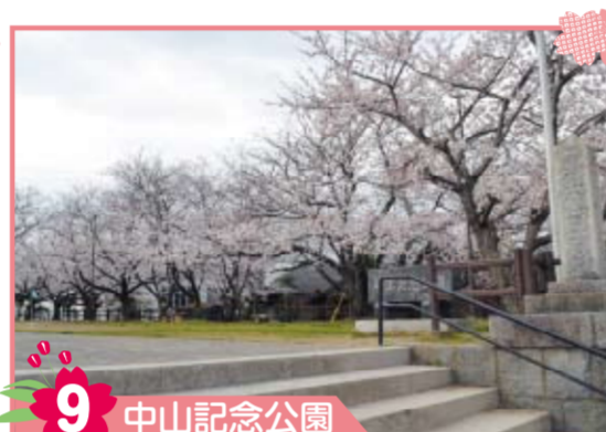
9 中山記念公園 公園内には郷土を愛し酪農育成に努め、京築地区の「酪農の父」と讃えられた中山悦治氏の翁徳碑があります。