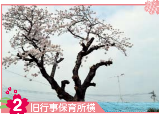
2 旧行事保育所横 以前はとても枝ぶりによい桜でしたが、ある日突然今の姿になっていました。