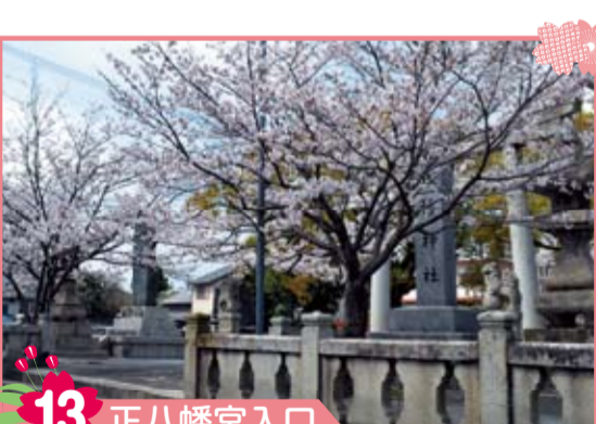
13 正八幡宮入口 昭和62年の春、当時の魚町長寿会有志により植樹された桜並木の参道です。境内の片隅には、思い出を込めた句碑もあります。