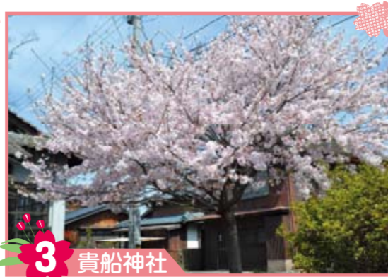
3 貴船神社 9月の上旬には風鎮祭が行なわれます。神社では大蛇退治やえびす神楽の舞が奉納されます。