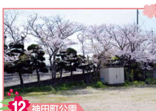
12 神田町公園 今川と正八幡宮の間に位置する都市公園です。小さな公園ですが春には美しい桜が咲きます。隠れたお花見スポットです。