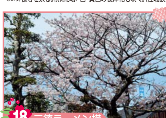
18 三徳ラーメン横 先代の原田正三が家を建てた頃にソメイヨシノ2本を植樹したそうです。内1本は台風で倒木し、現在は1本が残っています。樹齢は約85年です。