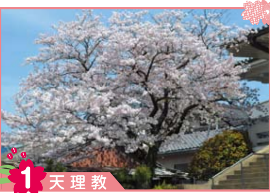
1 天理教 樹齢47年です。