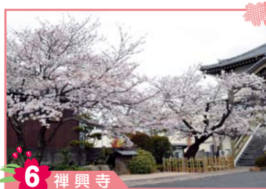
6 禅興寺 本堂に近い桜は樹齢100年、山門に近い桜は約40年です。曹洞禅宗、禅興寺の境内の親子桜が華やかにしてくれます。