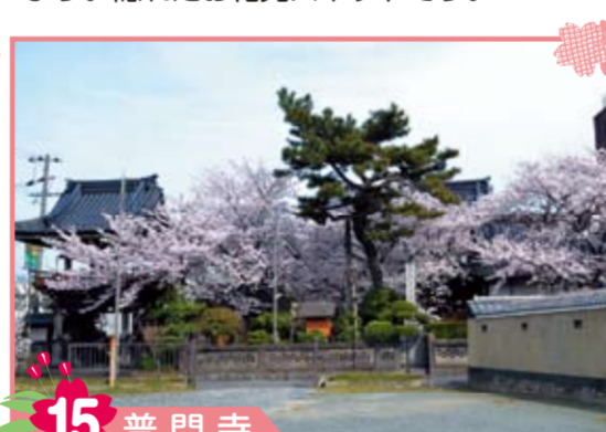
15 普門寺 日蓮宗寺院。境内には子供の守り神である鬼子母神(きしもじん)、身体の悪い所を水で洗い清めて病気を癒す浄行(じょうぎょう)様等を祭る。秋には赤・白・黄色の彼岸花も咲く。(住職談)