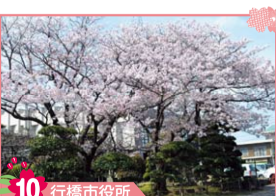
10 行橋市役所 市役所庁舎と市民会館の間に大きな桜の木が2本あります。